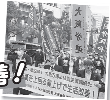
決起集会後のデモ行進