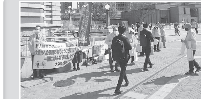
大阪市新入職員発令式前宣伝

大阪春闘共闘委員会と大阪労連は、2024年国民春闘ヤマ場の最大のとりくみとしてのべ3000人の参加で「3・14大阪総行動」を実施しました。大阪市内では、なはんば・淀屋橋の2カ所での早朝宣伝を皮切りに宣伝カーの運行、ランチタイムデモ、春闘勝利総決起集会&デモ行進など、終日行動を繰り広げました。