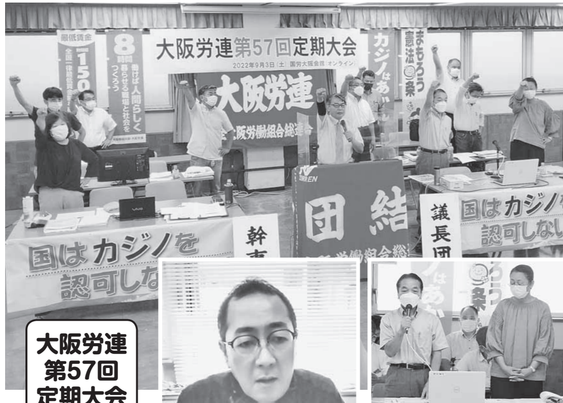
大阪労連 第57回 定期大会