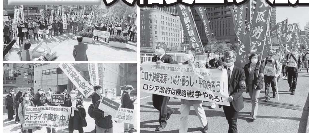
▲左上:3・10決起集会での団結ガンパロウ 左下:ランチタイムデモに参加する福保労の仲間 右:春闘勝利!デモ