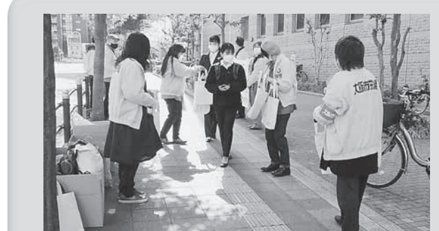
大阪市新入職員発令式前宣伝

新入職員・社員のみなさんの「いい仕事したい」という思いは、安全・安心に働ける職場があってこそです。私たち大阪労連は、新入職員・社員のみなさんの思いを実現していくために、職場環境の改善など、様々な取り組みを進めています。「いい仕事したい」というあなたの思いを、労働組合に入って一緒に実現していきましょう。