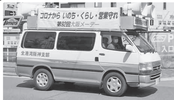
宣伝カーによる宣伝

第92回大阪メーデーは、感染拡大と緊急事態宣言の中、扇町公園での集会・デモ行進から、集会のオンライン配信・Twitter・デモ・宣伝カーによるメーデー宣伝に切り替え、開催しました。 菅義人実行委員長(大阪労連議長)は、「働くもののいのちと健康、安全を最優先に、政府に対し『軍事費削減、消費税減税でコロナ対策にまわせ、医療提供体制、公衆衛生体制の拡充』を強く求めよう。総選挙では、市民と野党の共闘の力で自公政権を退陣に追い込み、国民のいのちとくらし、憲法をいかにす政権への交代を実現しよう」と力強く呼びかけました。 杉本和野日本婦人の会府本部会長から連帯挨拶、清水ただし日本共産党衆議院議員から挨拶を受け、大阪労連の代喜副委員長が「これまでの国の医療費抑制政策が、コロナ禍での医療崩壊を招いている。公立・公的病院の統廃合計画を撤回し、診療報酬を大幅に増やし、医師と看護師の増員が必要。国にも、維新府政にもその責任を果たさせよう。『いのち署名』を全力で取り組もう」と決意表明。 団結カンパニーで閉会し、府下各地で宣伝カーの運行やスタンディング宣伝などで、「コロナ禍から国民のいのちとくらしを守る」と訴えました。