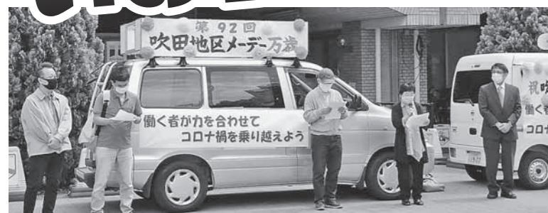
吹田地区メーデー