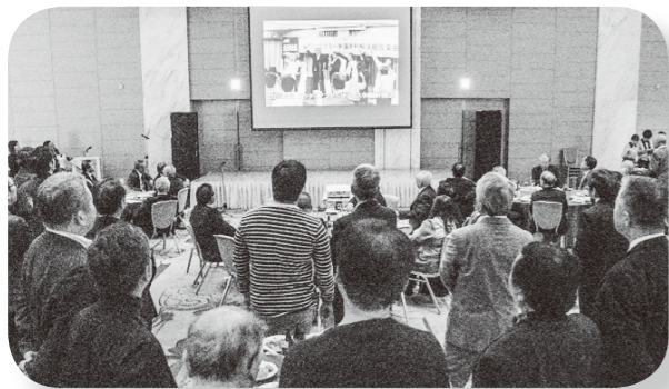
なつかしい映像に、みんな見入っていました

1月18日、大阪労連結成30周年・大阪労連共済発足10周年記念レセプションがシティプラザ大阪で行われました。弦楽四重奏で始まり、30年の歩みを記録した映像の上映では、過去のたたかひへの感嘆の声があがっていました。来賓の方々の多彩なスピーチで、この運動を未来へつなぐ決意を新たにすることができました。