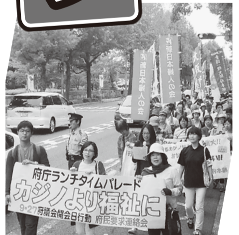
▲9月27日の府議開会日にカジノ、都構想はいらんの声を府庁へぶつけた

すべての組合員とともに、大奮闘で、安倍自公政権と維新の会に明確な審判を下しましょう!