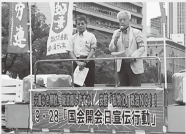
▲9月28日に淀屋橋で宣伝