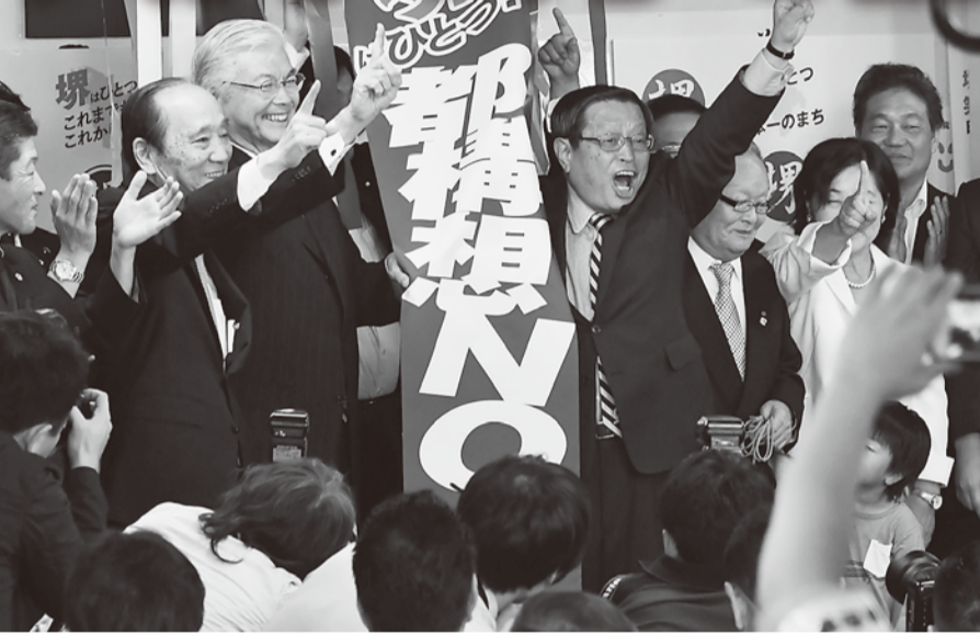
▲堺市長選挙では市民の共同で都構想NOを示し、維新政治を打ち破った