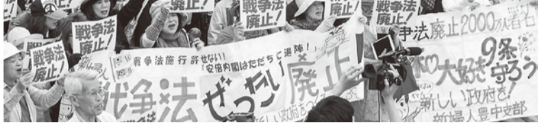
5.3大阪総がかり集会

7月10日投開票の参議院選挙で、国民と4野党との共闘により11の1人区で統一候補が当選し、福島・沖縄では現職の閣僚を破りました。自民1強といわれるもとで、国民の共同が今後への“希望”を示しています。