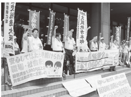
昨年の座り込み行動

大阪地方最低賃金審議会総会が7月5日に開催されました。7月28日に行われる総会では、最低賃金の大幅引き上げを求める労働局前座り込み行動を、10時~12時22分の142分間行います。