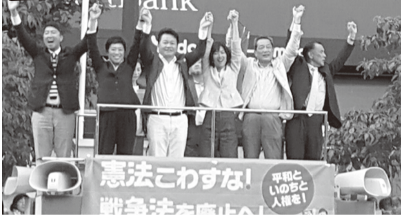
6.5おおさか総がかり大行動