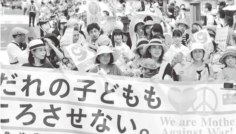
戦争法案に反対して街頭の人たちにアピール=7月26日、東京都渋谷区